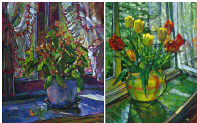
窗外阳光明媚 54×65 cm 2008年 窗台上的郁金香 46×61cm 2008年

出版有:《Zili LI 油画作品集》(1991年,香港开益出版社)、《李自力肖像画作品集》(1994年,上海人民美术出版社)、《李自力人物肖像画》(1995年,香港明报出版社)、《Zili LI 油画作品集》(2002年,法国 EURASI SARL 出版有限公司)。