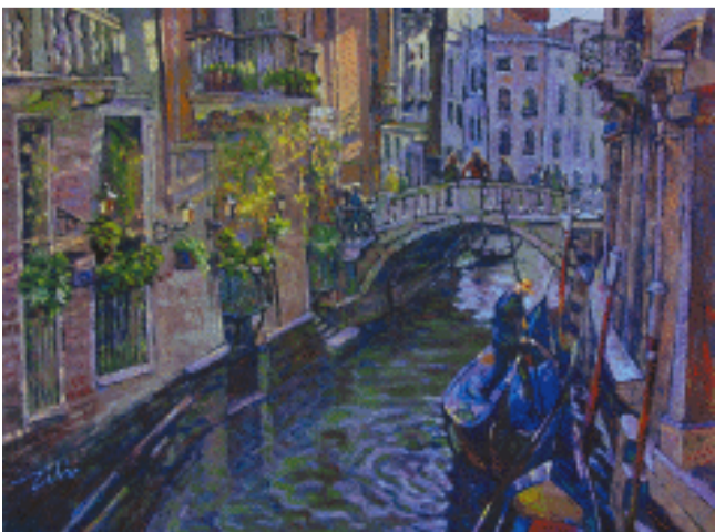
光缕 73×54 cm 2008年