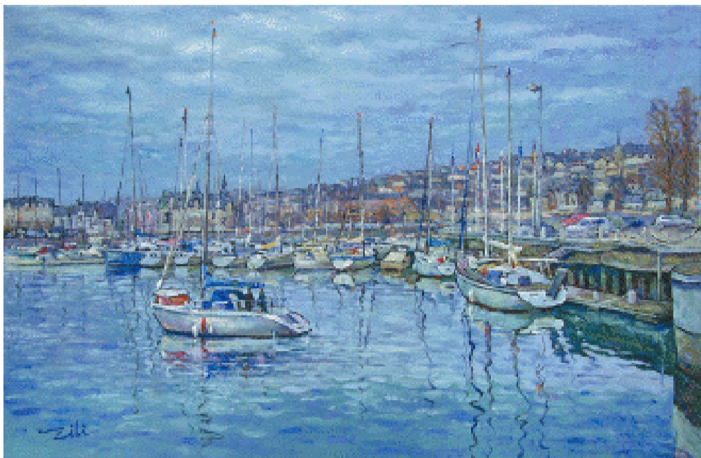
水色天间 100×65 cm 2008年

法国著名艺术评论家米歇尔·罗兰曾这样评价道:“李自力无疑是当今世界上为数不多的真正把握色彩钥匙的实力派画家。”大自然是美丽的,而李自力所呈现的后印象主义当代派艺术世界的开放性则使我们感动,因为它展示的是当今人类审美精神的一种体验,同时也是对生活的感悟,对情感的冥想。