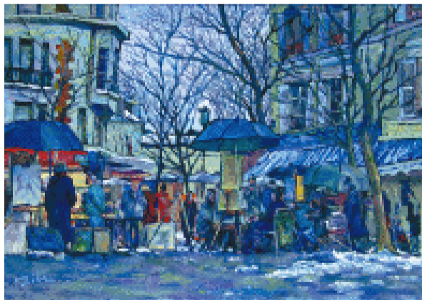
蒙马特的街头画家 65×46 cm 2006年