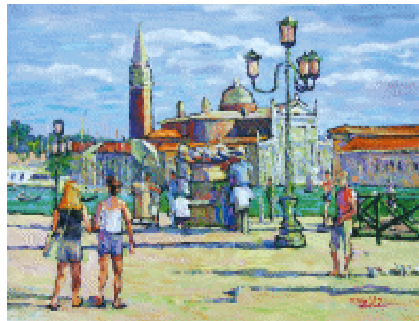
假日 53×40.9 cm 2005年